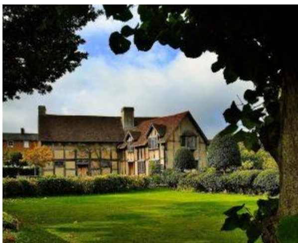
Дом в Стратфорде, где родился Шекспир. Сейчас музей

Великий драматург Уильям Шекспир появился на свет в 1564 году. Точные данные о дне рождения не сохранились. Город Стратфорд-апон-Эйвон (Англия) считается местом его рождения.