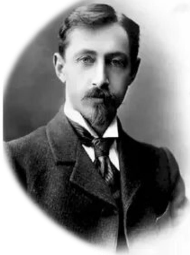
Иван Алексеевич Бунин 1870-1953